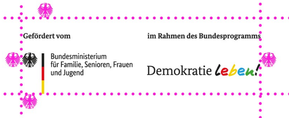
Illustration: Schutzraum um das Logo

in der kein anderes Element platziert werden darf. Die Schutzzone hat zu jeder Seite hin die Breite von einem Adlerelement.