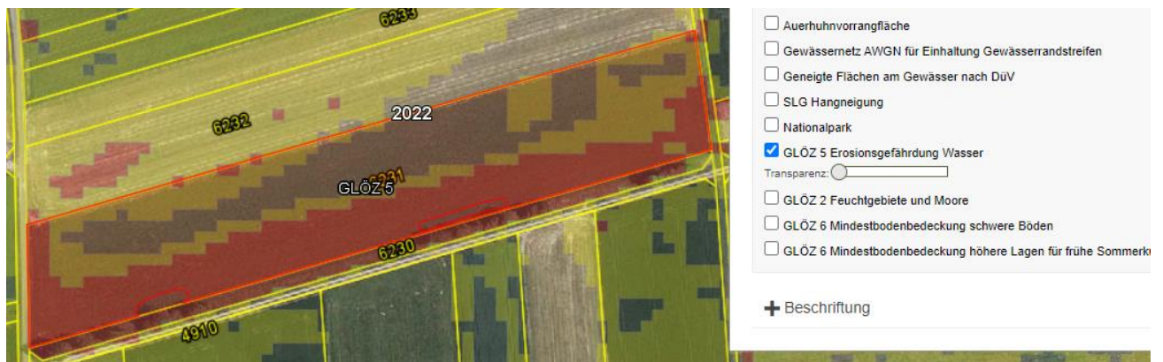
Abbildung 1: Umweltdatenlayer „GLÖZ 5 Erosionsgefährdung Wasser“

Für alle landwirtschaftlichen Flächen in Baden-Württemberg wurde unter Berücksichtigung der drei Faktoren die Erosionsgefährdung je 5 x 5 Meter Rasterzelle berechnet. Die rasterbasierte Erosionsgefährdung ist unabhängig von Flurstücksgrenzen und unterliegt keiner von der Kultur abhängigen jährlichen Veränderung. Im FIONA-GIS im Reiter Karten sind unter „Umweltdaten“ im Layer „GLÖZ 5 Erosionsgefährdung Wasser“ die einzelnen 5 x 5 Meter Rasterflächen sichtbar.